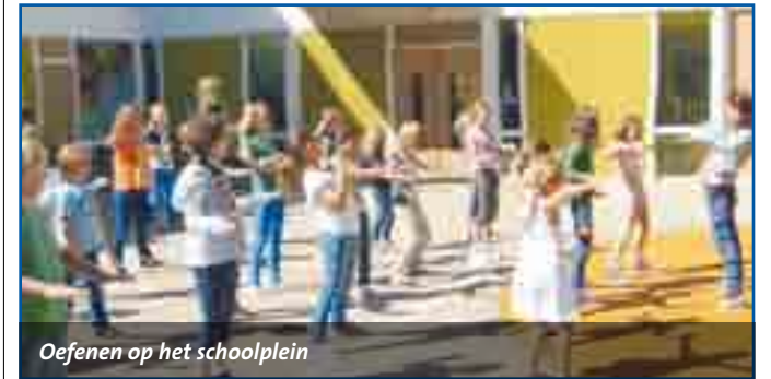
Oefenen op het schoolplein

Door middel van een 'flashmob' heeft de Zandvoortse theaterschool Het Nest zich zaterdagmiddag aan het Zandvoortse publiek gepresenteerd. Een flashmob is een (vaak grote) groep mensen die plotseling op een openbare plek samenkomt, iets ongebruikelijks doet en daarna weer snel uiteenvalt.